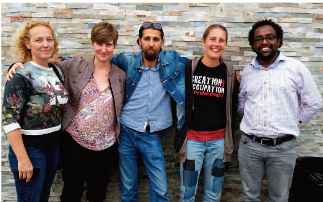
Samordnarträff på Rosengård.

Finansiärer: AMIF, MUCF, FINSAM, Europeiska Integrationsfonden, Hållbar Utveckling Skåne och övriga projektpartners, Innovationsplattform Malmö Sydost, Bromölla kommun och Sparbanken Syd.