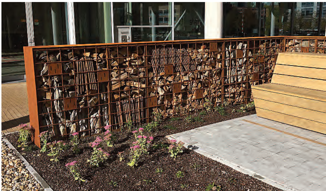
Vind- och insynsskydd och samtidigt boplats för vilda pollinatörer vid Park 20|20, Hoofddorp, världens första cradle-to-cradle inspirerade kontorspark i Nederländerna.

Klimatsamverkan Skåne, Energimyndigheten, Länsstyrelsen Skåne, Hållbar Utveckling Skåne, Malmö stad, Region Skåne, Energikontoret Skåne samt kommunerna Eslöv, Höör, Klippan, Osby, Skurup, Staffanstorps och Tomelilla.